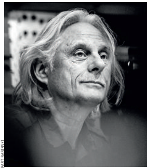
ECM Festival Cinquante ans du mythe label munichois en présence de Manfred Eicher. (20-24/11)