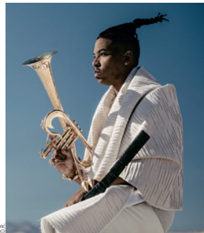
Christian Scott aTunde Adjuah Première venue du trompettiste américain à Bruxelles, avec son sextet. (07/11)