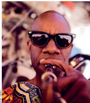
Ryan Porter Retour de la génération dorée du jazz californien, avec Kamasi Washington au saxophone. (21/10)