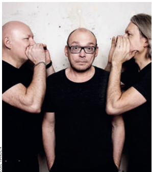
Rymden Trio scandinave à la croisée du jazz moderne et de la musique de Jean-Sébastien Bach. (11/10)